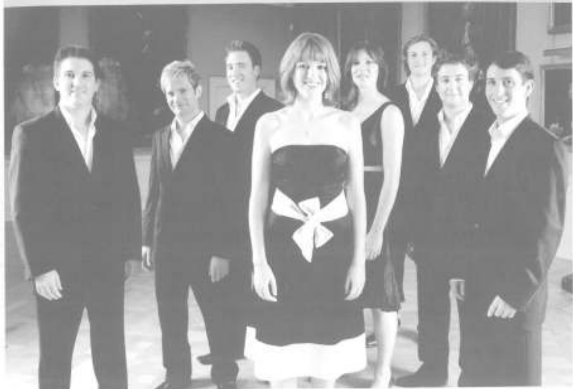
VOCES8 FINCHAMPSTEAD - REINO UNIDO