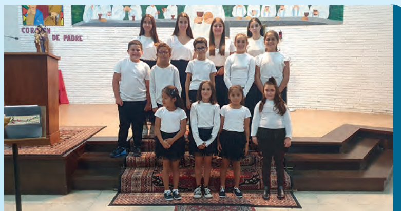
Coro Infantil Juvenil San José de Requejada