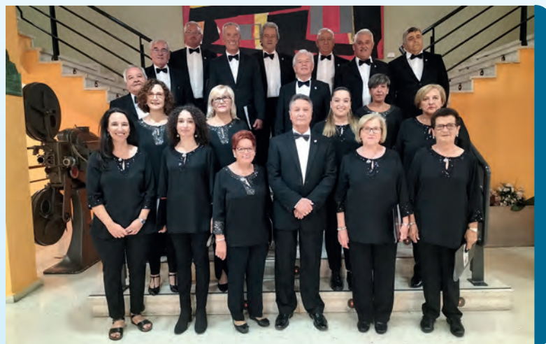
Coro San José de Requejada