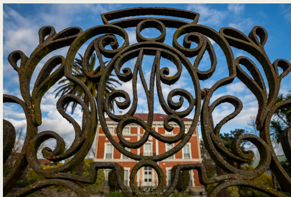
Finca La Trascolina Antigua casa de veraneo de José M a de Pereda

El centro está ubicado en la que fuera casa de veraneo del escritor José M a de Pereda, en la finca La Trascolina de Polanco, que cuenta también con un extenso jardín formado por una gran variedad de especies botánicas.