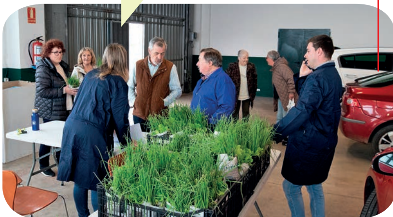
Vecinos asisten a una de las entregas de plantones del proyecto de Huertos Naturales

El Ayuntamiento, a través de la Concejalía de Medio Ambiente, repartió en 2025 una cifra récord de plantones dentro de la campaña de introducción al cultivo de los huertos naturales. Se entregaron a los vecinos 39.273 plantones de cebollas, lechugas, fresas, tomates, pimiento, judías, calabacín, puerros, coliflor, repollo y brócoli entre las 817 solicitudes que las solicitaron en las cuatro tandas de la campaña, siempre coincidiendo con la mejor época para la poner la huerta en producción. Por ello, el Consistorio anuncia su intención de mantener esta iniciativa que tan buena acogida tiene.