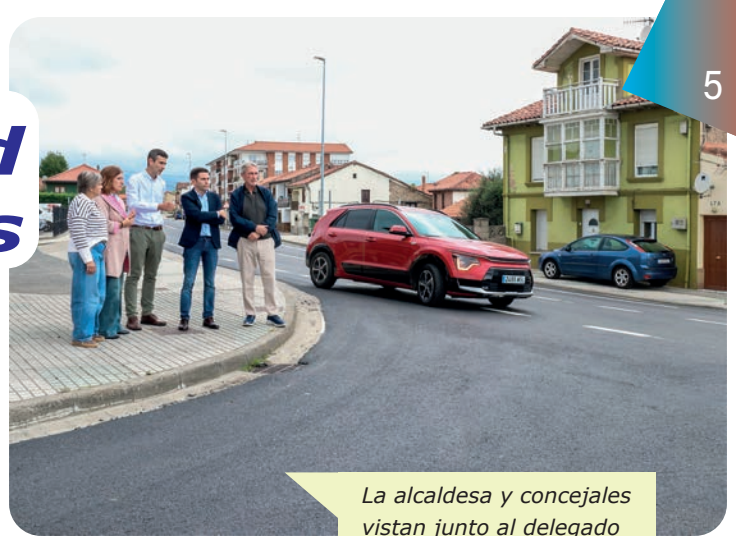
La alcaldesa y concejales vistan junto al delegado del Gobierno las obras realizadas en la travesía de Requejada. Abajo, enlace con la A-67 cuya mejora se reclama

Mientras tanto, la antigua carretera nacional N-611 ha sufrido una importante inversión (586.000 euros) para humanizar la travesía de Requejada, con nuevo asfaltado, pasos elevados y mayor seguridad vial, ya que por esta vía circulan más de 14.000 vehículos de manera diaria.