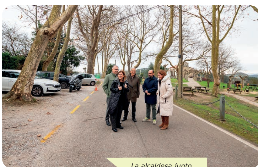
La alcaldesa junto a la presidenta, el consejero, el regidor de Miengo y responsables de la empresa adjudicataria

exión de Miengo y Polanco, con un tráfico medio de 1.000 vehículos diarios. Las obras van a consistir en la renovación del firme, la mejora del trazado, la ampliación de la plataforma y la instalación de nuevo drenaje, alumbrado y señalización.