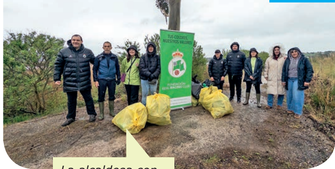
La alcaldesa con responsables de la Fundación Racing durante las labores de limpieza de la ría