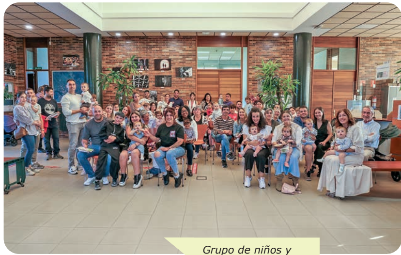
Grupo de niños y sus familias tras el acto de entrega de los cheques bebés y los árboles

los recién nacidos y premiar a quienes deciden asentarse y formar familia en el municipio, y aquí desarrollar su proyecto de vida, haciendo crecer un municipio que, poco a poco, ya supera los 6.100 habitantes.