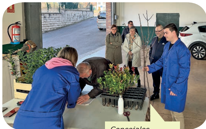
Concejales durante la entrega de los árboles a los vecinos que los solicitaron

Las peticiones se han mantenido en los mismo niveles de los últimos años: 114 familias participaron en este 2025, a las cuales se han entregado 60 acebos, 25 madroños, 25 nogales, 70 perales, 65 cerezos, 60 ciruelos y 80 manzanos. Sólo un dato significativo: el 70 % de las peticiones han sido manzanos, perales y cerezos.